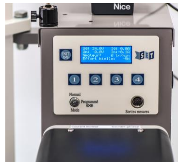
Panneau de contrôle et de commande sur base Arduino