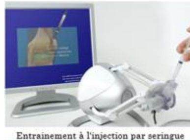
Entraînement à l'injection par seringue